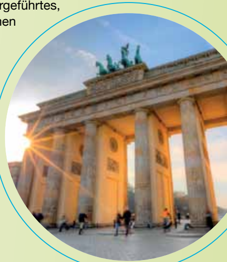
Jetzt auch an der Spree: hanfried eröffnet Filiale in Berlin.